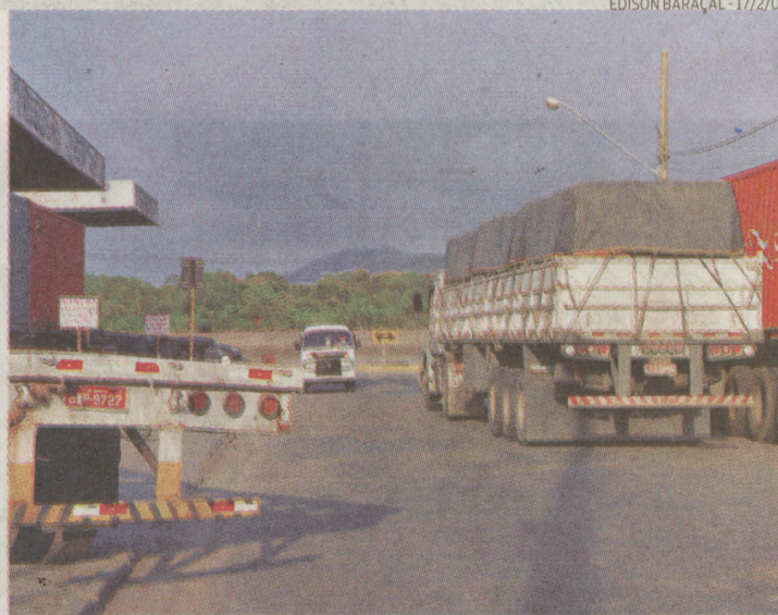
Rua do Adubo (1º plano) e Av. Santos Dumont (fundos) serão alargadas

Segundo a assessoria de imprensa da Codesp, as propostas com os documentos de habilitação dos consórcios foram abertas e rubricadas pelos membros da comissão de licitação