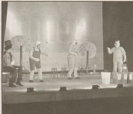
Lançamento do Recicle Ideias aconteceu no Teatro Guarany