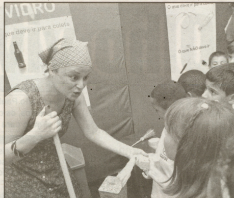
Mais de 200 crianças aprenderam brincando sobre a reciclagem